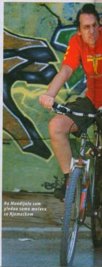
Na Mundijalu sam gledao samo mečeve sa Njemačkom

- Uhvatio sam se politike kada je bivša zemlja bila u tolikoj krizi da nam je prijetio rat. Tada je to ima-