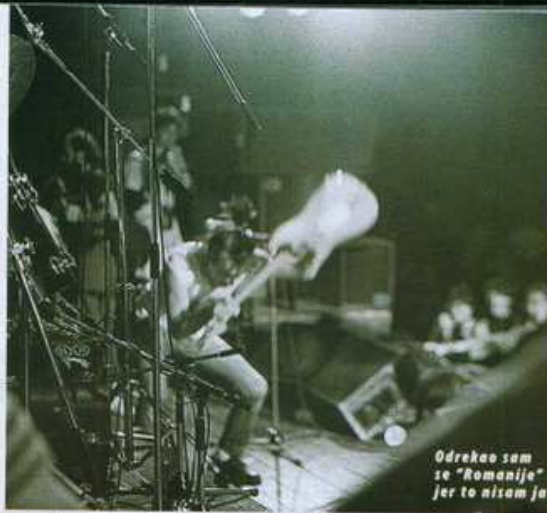
Odrekao sam se "Romanije" jer to nisam ja

- Dosta mi je njihove politike u kojoj oni mogu imati atomske bombe i svima prijetiti. Oni su,